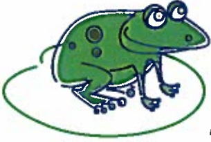
Ilustración – Como cocinar una rana

Se dice que si uno mete una rana en agua hervida, salta inmediatamente del hoyo para salvarse la vida. Pero si uno mete la rana en agua tibia, y lo calienta poco a poco, la rana se queda quieta, hasta achicharrarse. Satanás nos atrapa de esta manera, llevándonos poco a poco hacia el pecado que quisiéramos cometer.