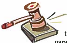
Ilustración de un Juez

Imaginemos que un joven fuera condenado por cometer un crimen. El juez, por ser justo, no pudo pasar por alto la infracción de la ley. El castigo impuesto por la ley fue una multa seria - $100,000. A pesar de estar totalmente arrepentido por lo que había hecho, el joven no tuvo ni un centavo para pagar la multa, y quedaba en peligro de ser encarcelado. Entonces el juez hizo algo totalmente inesperado. Se quitó su bata judicial, se bajó de su sillón de juicio, y se paró en el lugar del joven, ante el tribunal. Sacó su chequera, y pagó la multa. El juez hizo esto porque el condenado era su hijo, y lo amaba. Era necesario pagar la multa, y el juez lo pagó por el joven. Solamente una persona loca no dejaría se le pagara la multa. 1